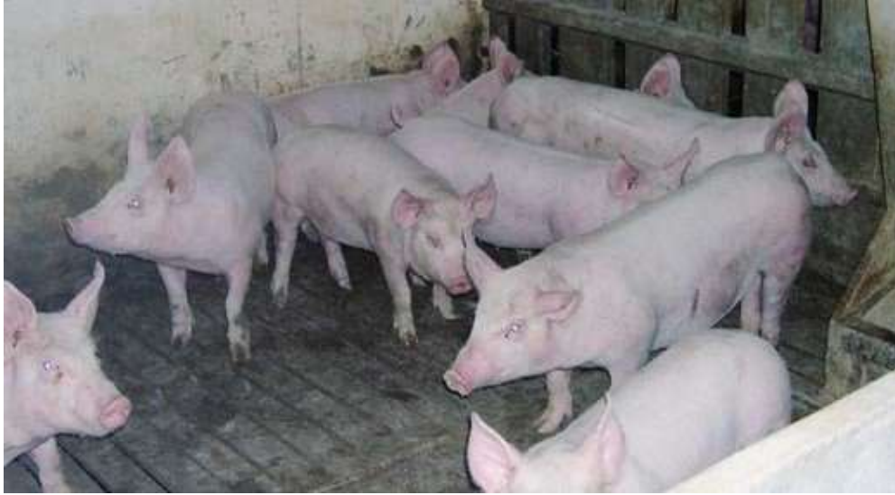
El mayor riesgo de caudofagia aparece entorno a los 40-50 kg peso vivo en suelos emparrillados sin cama.

A nivel experimental Breuer et al., (2001) desarrollaron un test mediante cuerdas en el que anotaban el número de mordidos, olfateos y lamidos que efectuaban los cerdos hacia ellas, así como la frecuencia y la intensidad de los mismos. Estos autores llegaron a la conclusión que los lechones que mostraban a las 4 semanas un comportamiento más intenso hacia las cuerdas tenían mayor probabilidad de desarrollar un comportamiento agresivo hacia sus congé-