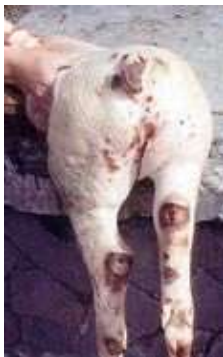
La caudofagia es una conducta anómala de etiología multifactorial que se manifiesta con la mordedura de la cola. (Fuente: Cornell Veterinary Medicine).