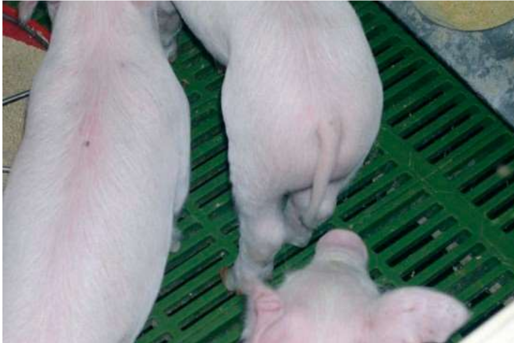
Colas largas o mal cortadas pueden predisponer a la caudofagia.

Por último, no nos podemos olvidar de la distribución del agua, ya que si existe una fuerte competencia por el mismo, bien porque hay un número insuficiente de bebederos o cuando no funcionan correctamente, puede ser el detonante de la aparición de brotes de caudofagia.