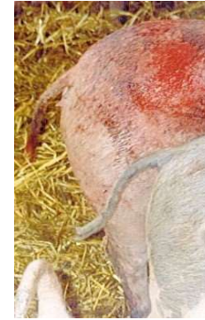
La presencia de heridas con sangre incita a una mayor intensidad de las mordeduras (Fuente: Universidad del estado de Iowa).

Otra pregunta que cabe hacerse es por qué la caudofagia se inicia por un determinado animal o a lo sumo por unos pocos de todos los presentes, pues bien, para este interrogante no tenemos una explicación científica, pero sí se ha observado que una vez iniciada la caudofagia se contagia rápidamente al resto de los individuos del corral e incluso a los de otros corrales, mediante un comportamiento de imitación. De tal manera que podríamos